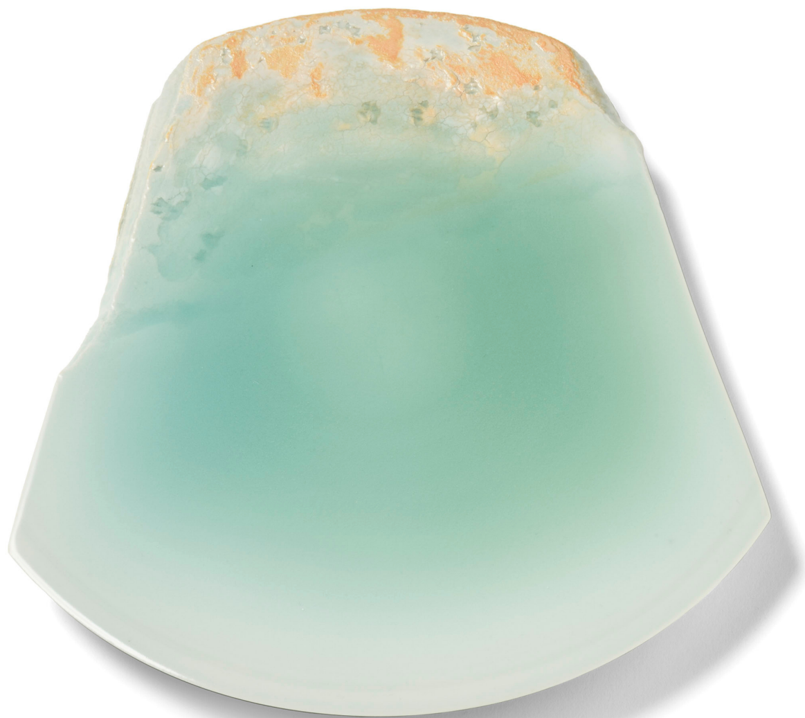
© Satoshi Kino Evening Tide Glazed porcelain 2021