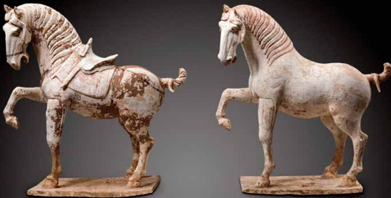
Chine, dynastie Tang (618-907), paire de chevaux, terre cuite, 48 x 49 x 20 cm (galerie Jacques Barrère).